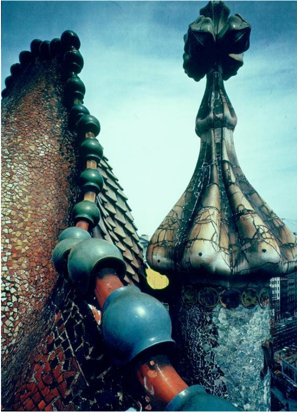
La Figura 5: Gaudí, Antoni. Casa Milá. 1904-1906. Exterior. Barcelona, España.